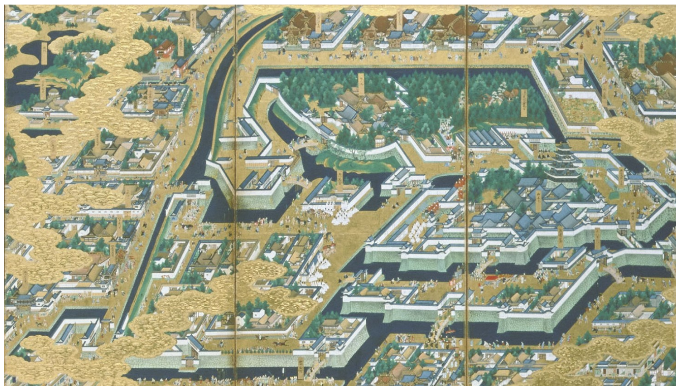
国立歴史民俗博物館所蔵「江戸図屏風」の一部を掲載