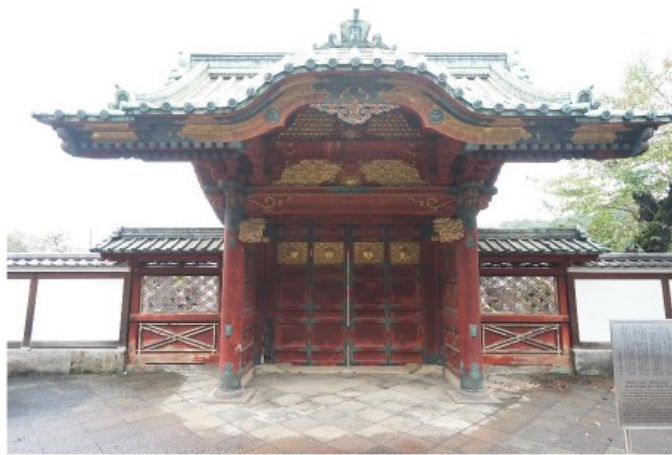
江戸の寺社-寛永寺 厳有院殿(徳川家綱)豊廟勅使門