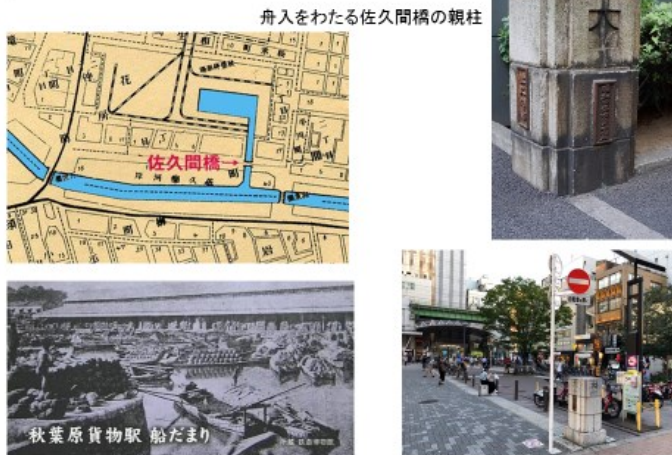
東京駅と秋葉原駅の舟入