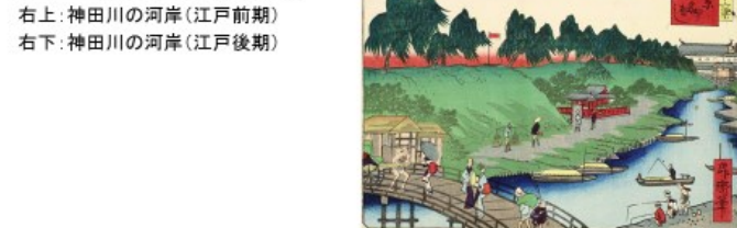
江戸時代の物流拠点