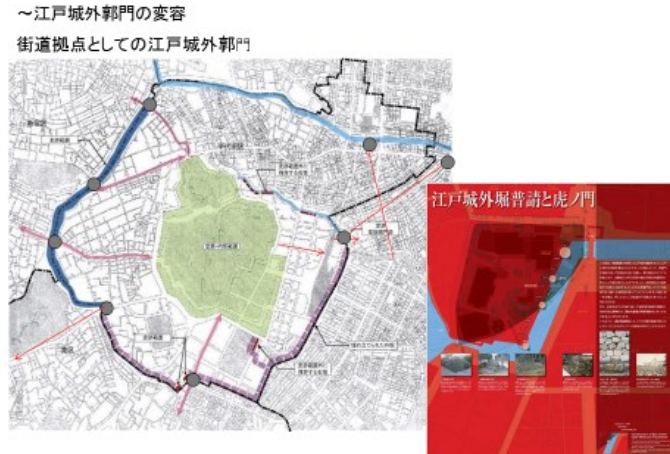
街道の拠点から鉄道の拠点