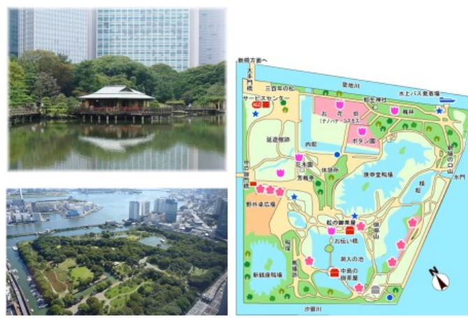
浜離宮庭園(将軍鷹狩りの潮入大名庭園)