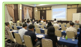
第1回キックオフセミナー風景

一般財団法人 江戸・東京歴史文化ルネッサンスの会 〒101-0051 東京都千代田区神田神保町2-20 ワカヤギビル501号 Eメール info@zaidan-edojo.or.jp 電話 03-6261-6812 FAX 03-6261-6813 ホームページ https://zaidan-edojo.or.jp/ ※「江戸城ルネッサンス」で検索 開局日時 毎週月曜日～木曜日の午前10時から午後4時迄