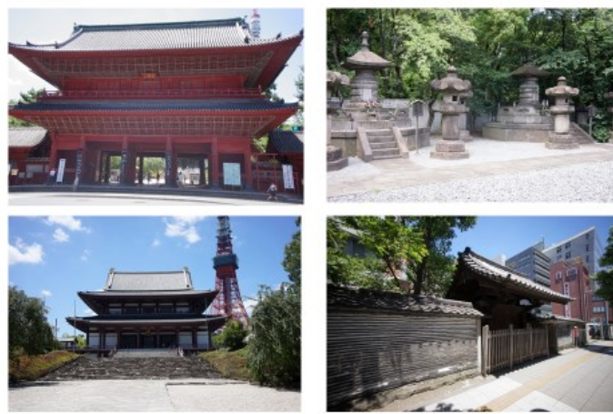
江戸の寺社-増上寺 三解脱門、大殿、家茂と和宮墓所、廣度院表門・練馬