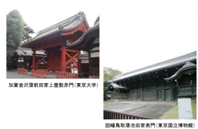
都内の残る大名屋敷跡